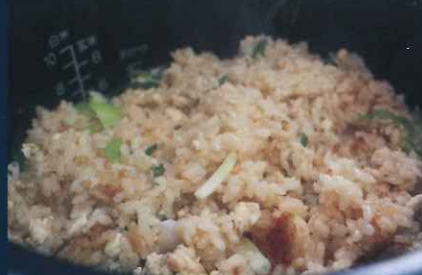
※材料がなくなり次第終了いたします。※写真はイメージです。